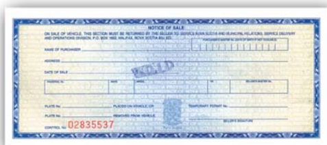
Formulaire d'avis de vente

d'immatriculation et le remettre à l'acheteur. L'acheteur doit remettre ce formulaire au Bureau des véhicules automobiles pour obtenir un nouveau certificat. Avant de vendre votre véhicule et tant qu'il est en votre possession, la vignette d'inspection doit être valide.