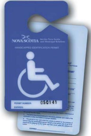
Carte de stationnement pour personnes à mobilité réduite

Si vous êtes une personne à mobilité réduite et que vous possédez et conduisez régulièrement un véhicule automobile, vous pouvez obtenir une plaque d'immatriculation spéciale à l'intention des personnes à mobilité réduite. La plaque spéciale qui vous est remise est assignée à votre véhicule. Vous pouvez aussi obtenir une carte de stationnement qui peut être utilisée dans n'importe quel véhicule en autant que le titulaire de la carte est à bord du véhicule. La carte doit être suspendue au rétroviseur lorsque le véhicule est stationné dans un espace désigné. Elle devrait être enlevée du rétroviseur avant de reprendre la route. Si vous stationnez dans un espace désigné sans avoir une plaque ou une carte de stationnement pour personnes à mobilité réduite, vous êtes passible d'une amende. En outre, votre véhicule peut être saisi et remorqué.