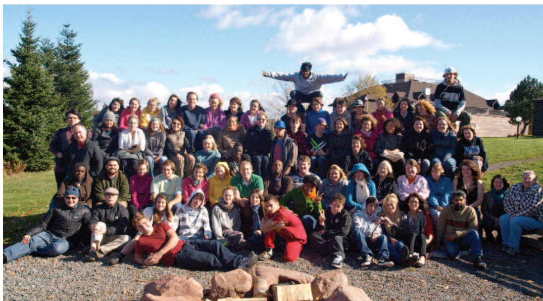
Conférence annuelle jeunesse « Leaders d'aujourd'hui », camp Tim Horton pour les enfants, Tatamagouche, Nouvelle-Écosse

La Stratégie est également appuyée par un réseau de jeunes et d'organismes pour les jeunes qui se nomme « Leaders d'aujourd'hui ». Ce groupe contribue à notre travail, renforce la voix des jeunes et offre un endroit où les jeunes et le gouvernement peuvent apprendre les uns des autres dans un environnement de respect.